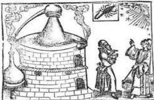
Eine alchemistische Transmutationsküche

Etliche liute hânt mich gevraget, waz armuot sî in ir selben und waz ein arm mensch sî. Her zuo wellen wir antwûrten: daz ist ein arm mensch, der niht enwil und niht enweiz und niht enhât. Meister Eckehard